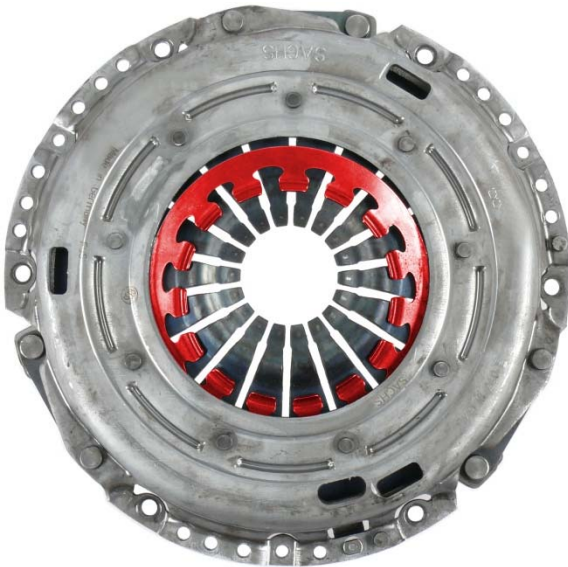
Obr. 4: Posunutá přídavná pružina

Více servisních informací najdete zde: www.zf.com/serviceinformation