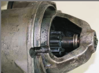
Hnací kolo nebo hřídel jsou namodralé v důsledku přehřátí