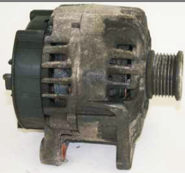
žádné poškození přístroje