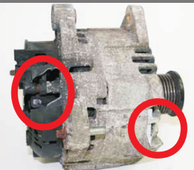
držák nebo plastový kryt jsou ulomeny