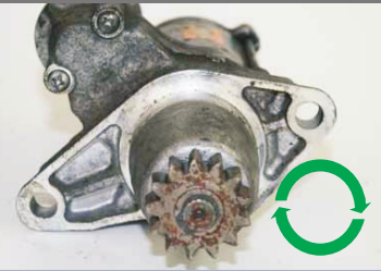
S hřídelí lze otáčet. Může být použito i nářadí, např. šroubováku.