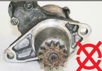
S hřídelí nelze otáčet, ani při použití nářadí.