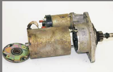
přístroj je rozebraný