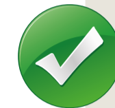
úplné a nepoškozené