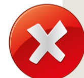
poškozené ozubení poškození vzniklá při demontáži