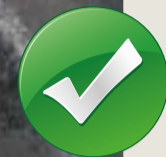
ozubení není poškozeno