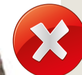
poškozené ozubení poškození vzniklá při demontáži